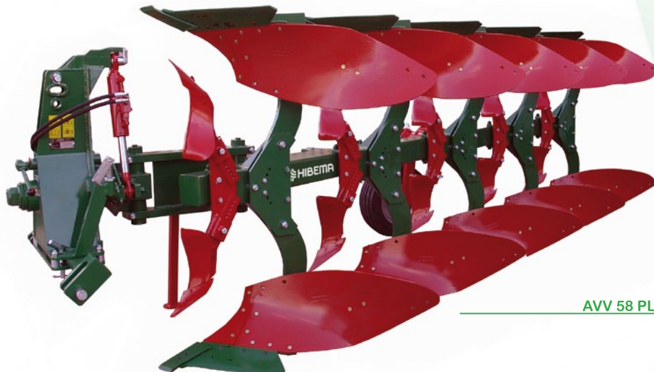
AVV 58 PL Rasetas