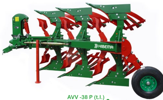
AVV-38 P (t.l.)