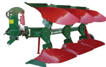
AVV-38 P T.Helic.