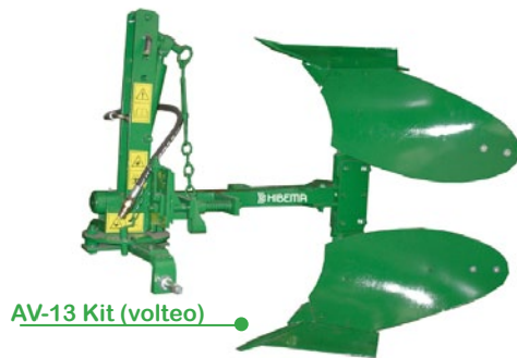
AV-13 Kit (volteo)